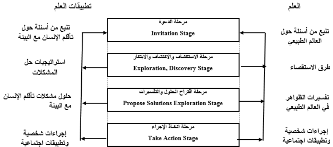
شكل (1) نموذج التعلم البنائي

يساعد نموذج التعلم البنائي الطفل على بناء المعرفة مع التأكيد مع ربط العلم بالتكنولوجيا والمجتمع، وهذا النموذج يعتمد على الفلسفة البنائية عند بناء الطفل للمفاهيم من خلال العمليات العقلية، وتسير هذه المراحل وفق خطوات متتابعة ومتكاملة حسب خطة سير الدرس الذي يتوقف على الموقف التعليمي ومبادئ ومعايير البنائية، وهذه المراحل الأربع كما وضحا كلا من (عباس الأمير ورحيم كيرو، 2014، 371-368؛ عزة عفافه، 2012، 274-276؛ محسن عطية، 2015، 302-304؛ ونجم الموسوي، 2015، 76-75؛ وليم عبيد، 2010، 179) ويوضح شكل (1) التالي رسما تخطيطيا لنموذج التعلم البنائي بمراحله الأربع: